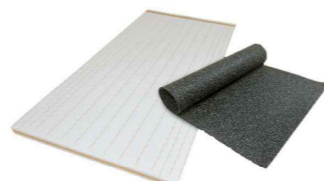
▲ジムボード ネオ/ラバーマット