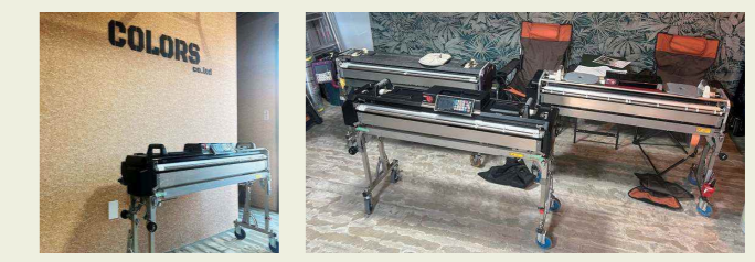
東京営業所 葛原 爽太郎