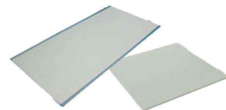
▲ウォッシュابل畳「きよらか」