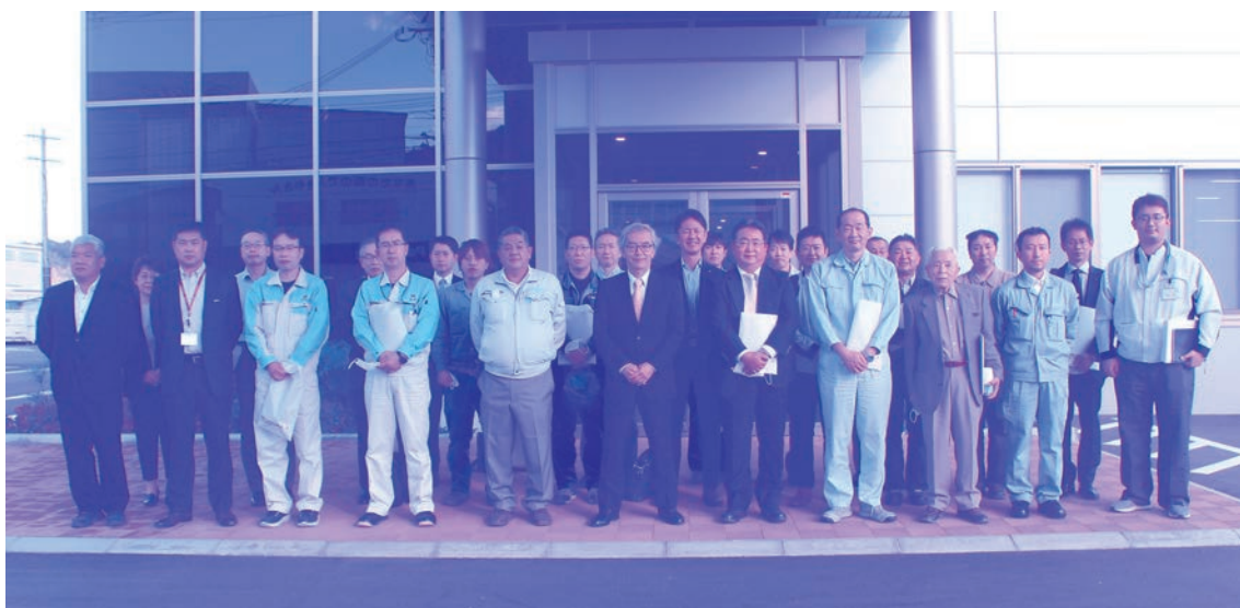
龍野商工会議所 一般工業部会様 会社見学 令和4年11月2日 当社神岡工場内 新工場（生産本部棟）前 ※撮影時のみマスクを外しています

発行／極東産機株式会社 〒679-4195 たつの市龍野町日飼190 ☎(0791)62-1771 編集／極東産機(株)総務部 ホームページアドレス https://www.kyokuto-sanki.co.jp/