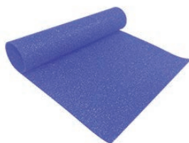
ラバーマット ロールタイプ

ていると伺います。昨年「ジムボードネオ」の上にダンベルを落として実際に演ずるコーナーを設けましたので、商品の防振性を体験してご納得いただければと思います。