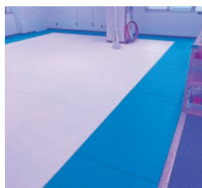
スポーツ畳マットRio

ご購入いただいた施設様からは、振動対策だけでなく「転んでも痛くないため安心」と満足していただいております。また除菌もしやすいこともポイントです。