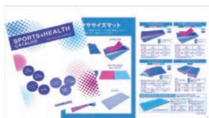
コンシューマ事業部

他にもリハビリ・ダンス施設向けの木目調の床材もご紹介いたします。フィットネスクラブ関係者様、教育現場関係者様のご来場をお待ちしております。