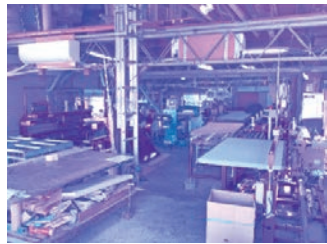
ものづくり補助金を活用して

きれないほどの仕事があり、寸法精度をあげ効率化を図るために、1995年「両框裁断機」「両框縫機」「平刺ロボット」「返縫ロボット」を導入していただきました。 その後機械が老朽化し、また、薄畳やヘリ無畳に対応するため、2009年に「両框縫機MAX」、2015年「両平刺機MASTER」に入替えています。