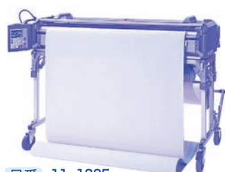
品番 11-1365 価格 418,000円(税別)