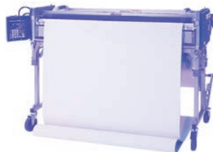
品番 11-1381 価格 374,000円(税別)