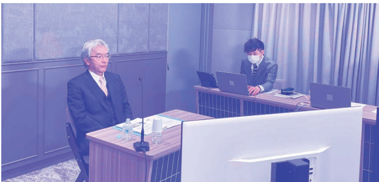
都内のスタジオよりWeb配信（2月26日(土)）