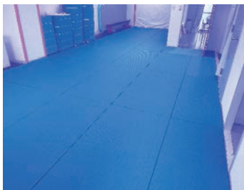
スポーツ畳マットRio

振動対策だけでなく 「転んでも痛くないため 安心」と満足していただ き、また除菌もしやすい ことも好評いただきました。