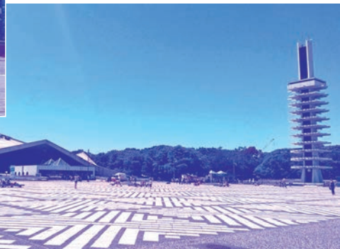
▶1964年東京大会の会場のひとつ、駒沢体育館 (現：駒沢オリンピック公園総合運動場体育館)

昭和39年の東京オリンピック―我が国が戦後復興から高度成長に向かう通過点であり、ひとつのゴールであった。国の経済力と国民の生活水準が共に右肩上がりを経ており、国民は復興と繁栄のシンボルとして、アジアで初の東京オリンピックをこぞって歓迎した。 地方住まいの私は、小学校行事として聖火リレーを国道2号線沿いで見送った他はテレビ観戦しか手段はなかった。終了後は新聞社発行の記録写真集を買ひ込み、繰り返し読んで日本の金メダリストはもろろんのこと、各国の金メダリストの名前まで一生懸命に覚えたものである。 翻って今回の東京オリンピック―招致が決定した8年前から「8歳で見た東京オリンピックを64歳でもう一度見る」ことをずっと楽しみにしてきたが、誰も想像すらしなかったコロナ禍の襲来で一年延期されるとともに、開催間近になってからの緊急事態宣言の再発出に伴う無観客化の決定、更には開催反対の大合唱の中の誠に残念なスタートとなった。 感染拡大は「しかるべき場所」に人が集まり「しかるべきこと」を行った結果生じるものであり、政府等の感染防止措置はその「集まること」「行うこと」を極力減らそうとするものであるから、そもそも国民がそれを守らなければ効果が出るはずもなく、感染者の増加は避けられない。 しかし感染者急増のすべての責めは、守らなかつた国民にはなく、感染防止措置の立案・実施を行う政府等に向かつていった。行動の制約を求められ続ける国民のやり場のない鬱屈した思いが「怒り」となって、政府等に対する非難の形で集中し、更にその政府等が進める「国家的事業」たるオリンピックの開催反対の大合唱にまで高まってしまった。 テレビのワイドショーは、そんな国民感情に「忖度」して「わが子の運動会が中止なのにオリンピックが開催されるのはおかしい」といった次元での報道に終始した。もちろん野党もそれと同レベルの論調で政権与党を非難するとともにオリンピック開催にも猛反対し、オリンピックが完全に「政争の具」と化したことは本当に残念で情けない思いであった。 かくしてオリンピックは始まり、折しもコロナ感染者の急増が止まらない中で、日本選手のメダルラッシュに日本中が熱狂していった。開催反対を唱えていたマスコミは、片や感染急拡大に警鐘を鳴らしつつ、片や日本選手の大活躍を賞賛するという難度の高い「離れ業」を演じて見せた。 そのような周囲の大騒ぎの中、アスリートの純粹かつ真摯な姿が、「コロナ」や「政治」や「報道の在り方」とは全く別次元で、57年の歳月を経て再び国民に大きな感動を与えてくれたことだけは間違いなかるう。