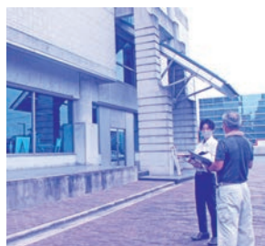
社内修繕打ち合わせの様子