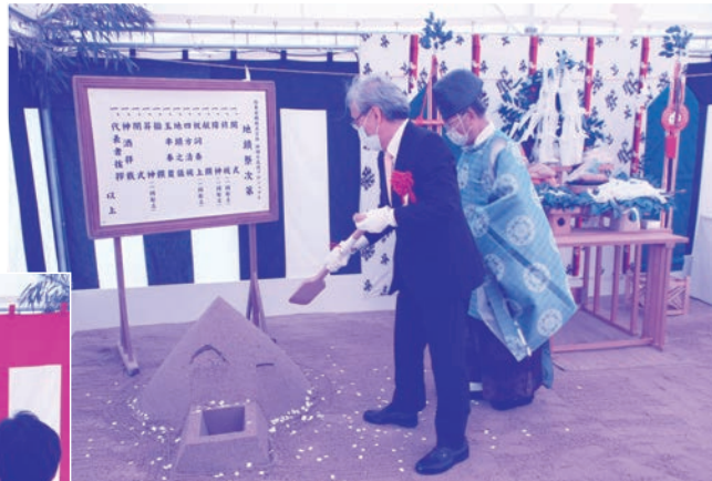
▲地鎮之儀において「穿初(うがちぞめ)之儀」を行う頃安社長