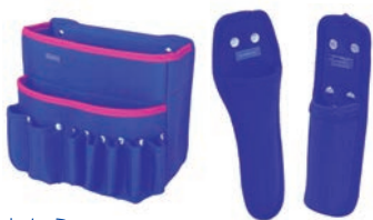
左から 11-8227 ツールバッグ匠 11-8228 ワンタッチハサミサック匠 11-8229 ワンタッチローラーサック匠

◇ツールバッグ匠 好みの収納にカスタマイズ可能なこだわりのツールバッグです。 メインポケットに着脱可能なポケットを採用し、左右にはワンタッチハサミサック匠や、ワンタッチローラーサック匠を装着できます。