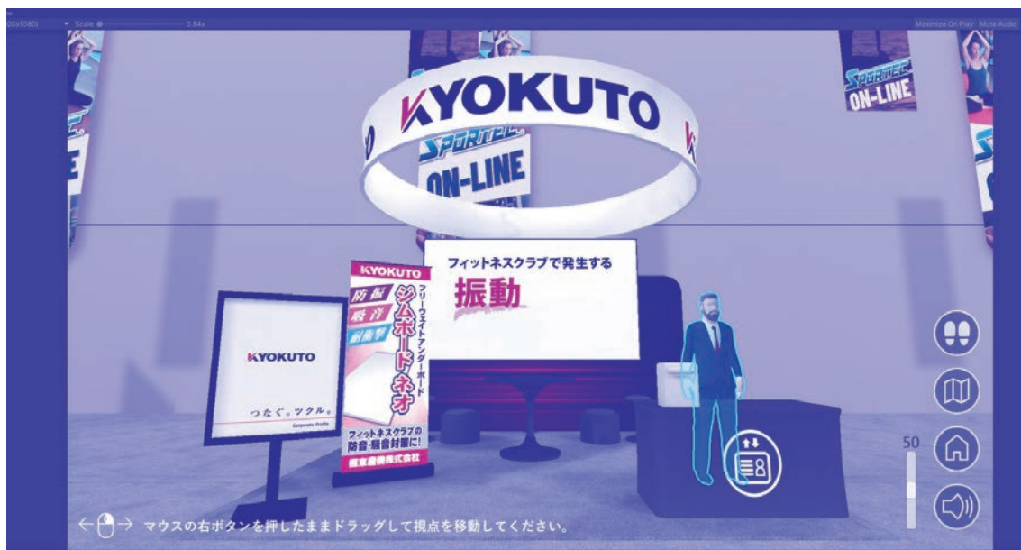
SPORTEC2021 オンライン展示会 当社バーチャルブース (令和3年1月27日~29日開催)