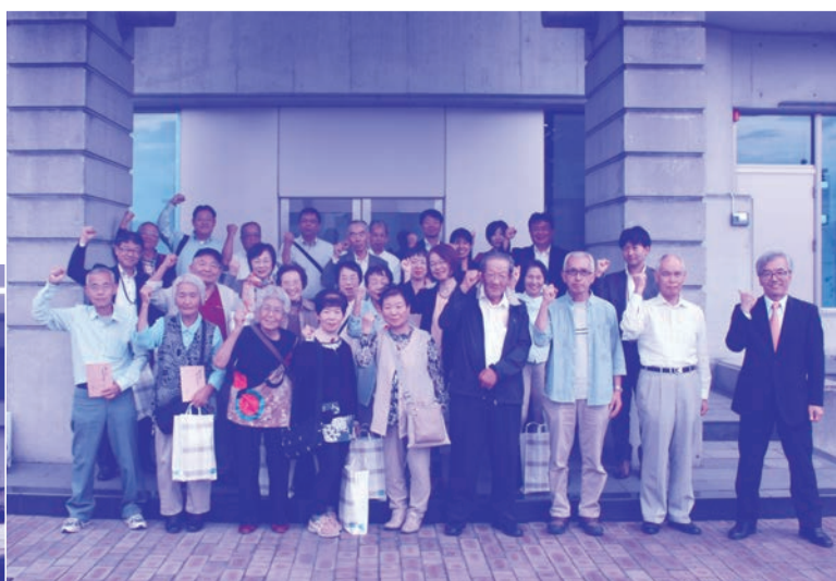
令和元年度 第1回龍野産業・観光ツアー／ たつの市の上場会社3社を巡る (令和元年10月8日火) 本社玄関前にて)