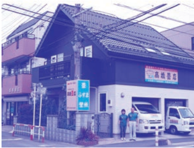
豊事業部門 北関東担当

「情報は宝物」と、極東産機開催イベントにはご夫婦で必ず参加され、「構造改革」を実行中のJCS豊店様との交流を楽しみにおられます。「あの時、決断して良かった。」この言葉を何うのが営業マンとして何よりの喜びです。