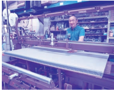
第一回コンサルティング受講の翌週、2万5千円の表替+新豊24豊で、一軒で90万円の商談獲得となり、まるで「狐にまつまされた様な気分」だったとか。

様で開催の「見学会&セミナー」に参加して確信となり、平成29年6月、「両用ロボットVICtory」+「キョクトローコンサルタント」を受講し、「構造改革」をスタートさせました。