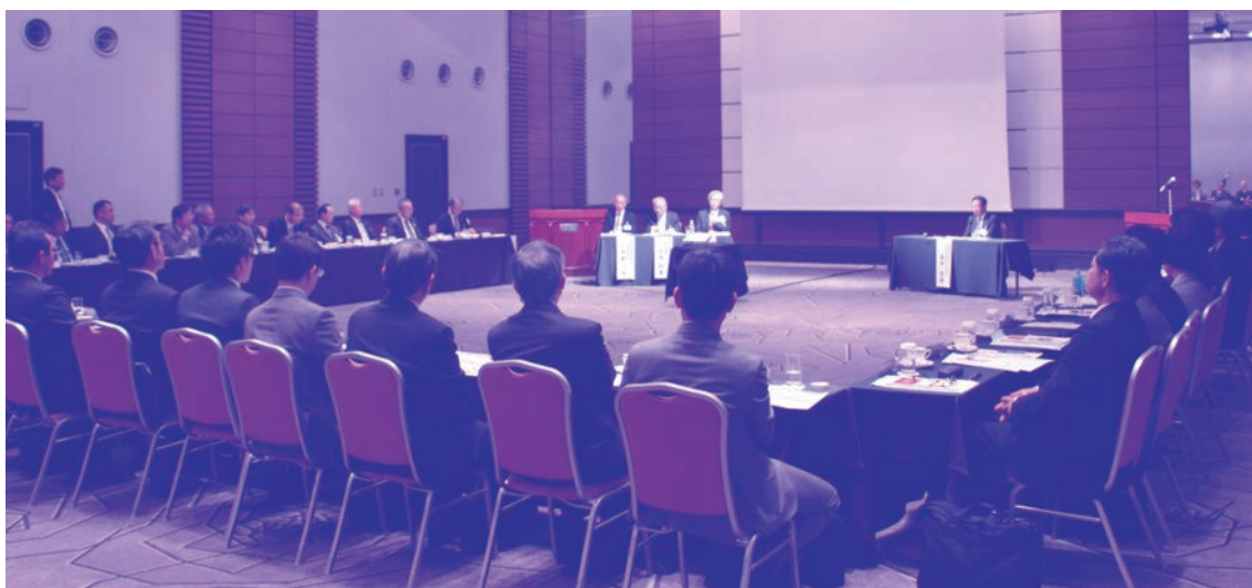
— ものづくり技術懇話会（平成30年11月6日 於：ホテル日航姫路） —