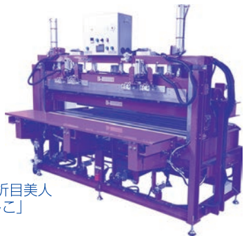
一豊用折目美人「なでしこ」