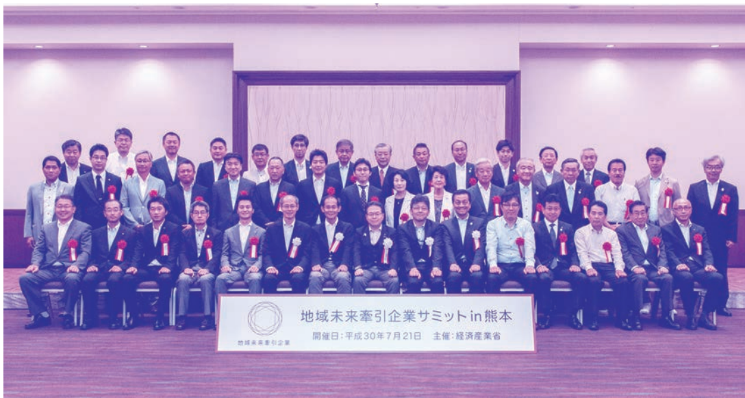
—前列中央が世耕経済産業大臣、中列右端が頃安社長—