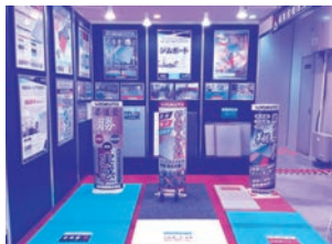
SPORTEC 2018 当社ブース

先日、7月25日〜27 日、東京ビッグサイトに て開催された日本最大級 のスポーツ・健康産業総 合展示会「SPORTEC 2018」に出展し、「ジ ムボードネオ」をお披露 いたしました。