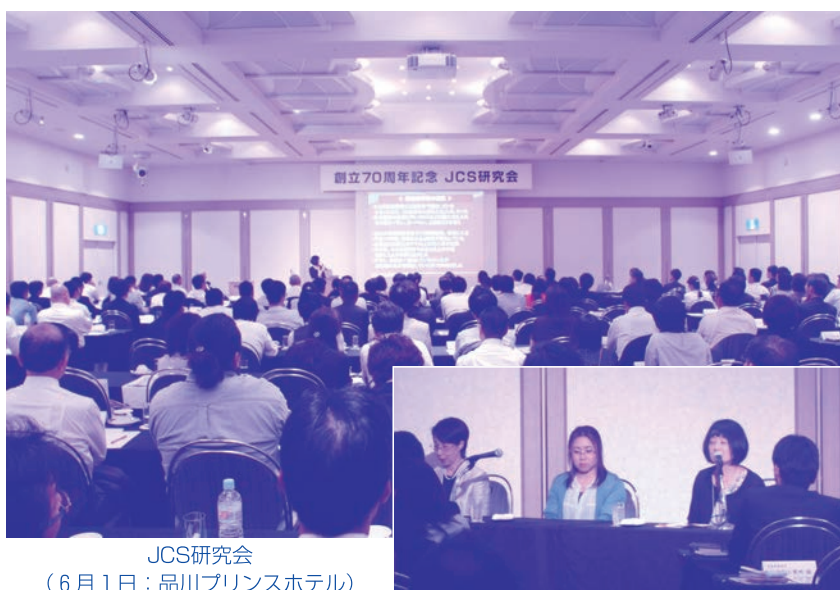
JCS研究会 (6月1日：品川プリンスホテル)