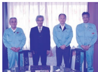
左から 瓜本本部長、頃安社長、 清水主任技師、中野主任技師